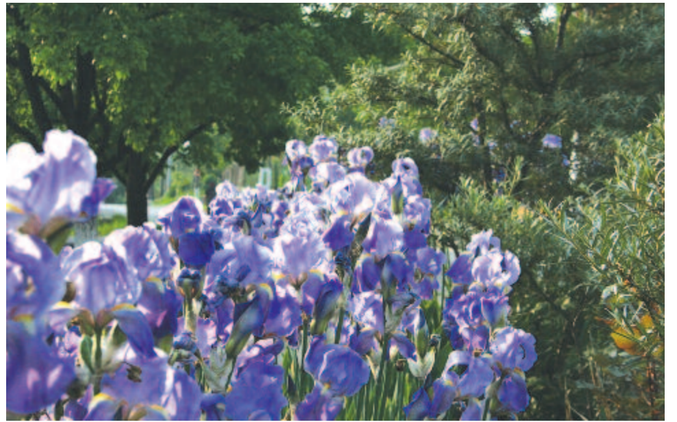
És nem lehetek virág egy síron – Nőszirmok buja pompája gyorsan hervadó szépség

Hófolt valánk mi, északos erdőszegélyen, de utolért a Nap vad mosolya. Heve elől, csakhogy meg ne emésszen, szétszaladánk s elnyelt a pocsolya.