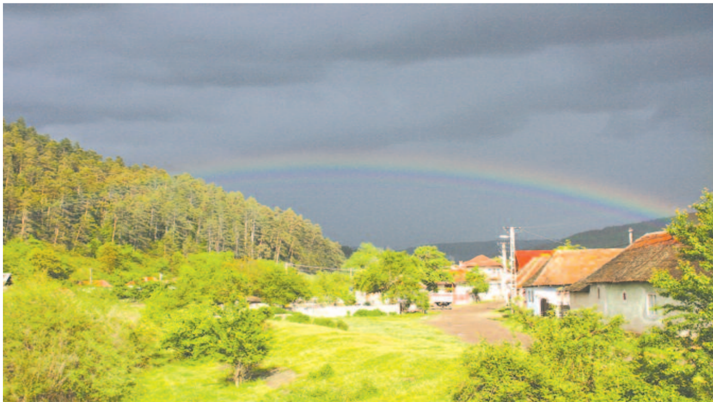
Gyors nyári fergeteg jön messziről – szivárvány Középpajta fölött

Kelt 2018. Szent Iván havának első napján